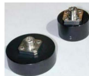
Collimateurs de type réceptacle