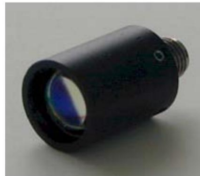
Collimateur de type SMA