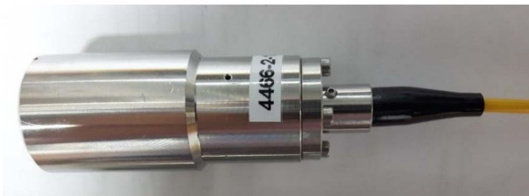
Collimateurs haute puissance